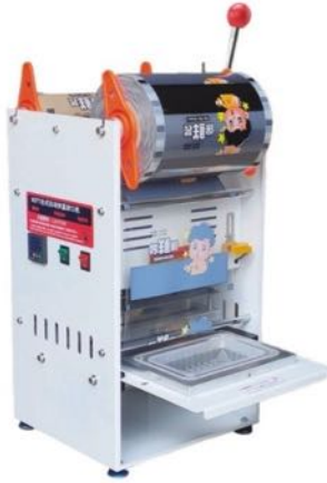
手动铝盒/餐盒封口机 MANUAL ALUMINUM BOX / LUNCH BOX SEALING MACHINE