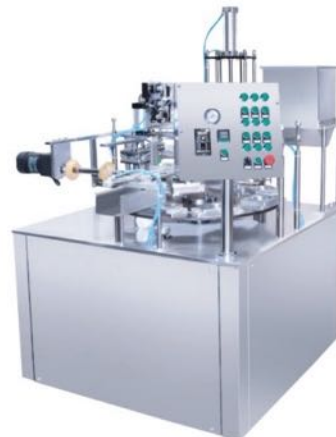
转盘式灌装封口机 ROTARY FILLING AND SEALING MACHINE