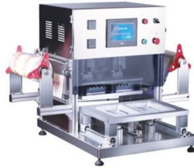
气动卷膜封口机 PNEUMATIC FILM SEALING MACHINE