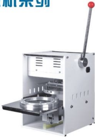
手动铝盒/餐盒封口机 MANUAL ALUMINUM BOX / LUNCH BOX SEALING MACHINE