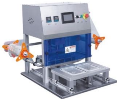
台式气动封口机 DESKTOP PNEUMATIC SEALING MACHINE