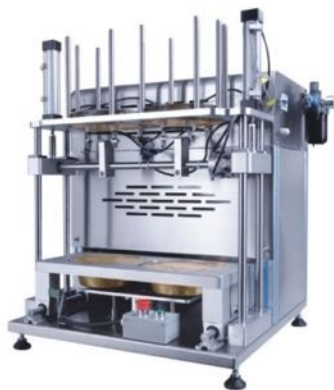
全气动铝箔餐盒封口机 PNEUMATIC ALUMINUM FOIL LUNCH BOX SEALING MACHINE