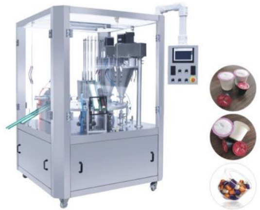
咖啡胶囊圆盘灌装封口机 COFFEE CAPSULE FILLING AND SEALING MACHINE